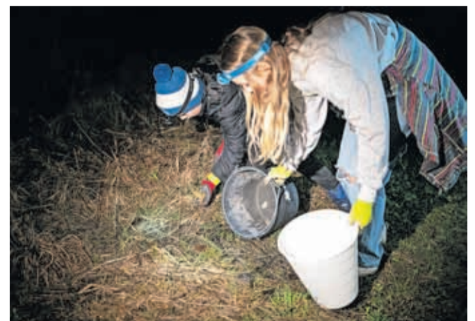
Žabe so prostovoljci prenašali na kilometer dolgem območju pod Sv. Joštom.