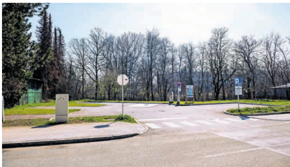
Postajališče za avtodome PZA Vodovodni stolp / FOTO: FOTOARHIV ZTK

Kranj v povprečju vsako leto obišče približno tisoč avtodomov. Obisk je najvišji med majem in septembrom, kljub temu pa obisk beležimo čez celo leto, tudi v zimskem času. S širitvijo ponudbe za turiste, ki potujejo z bivalnimi vozili, pričakujemo, da bo avtodomarskega turizma še več.