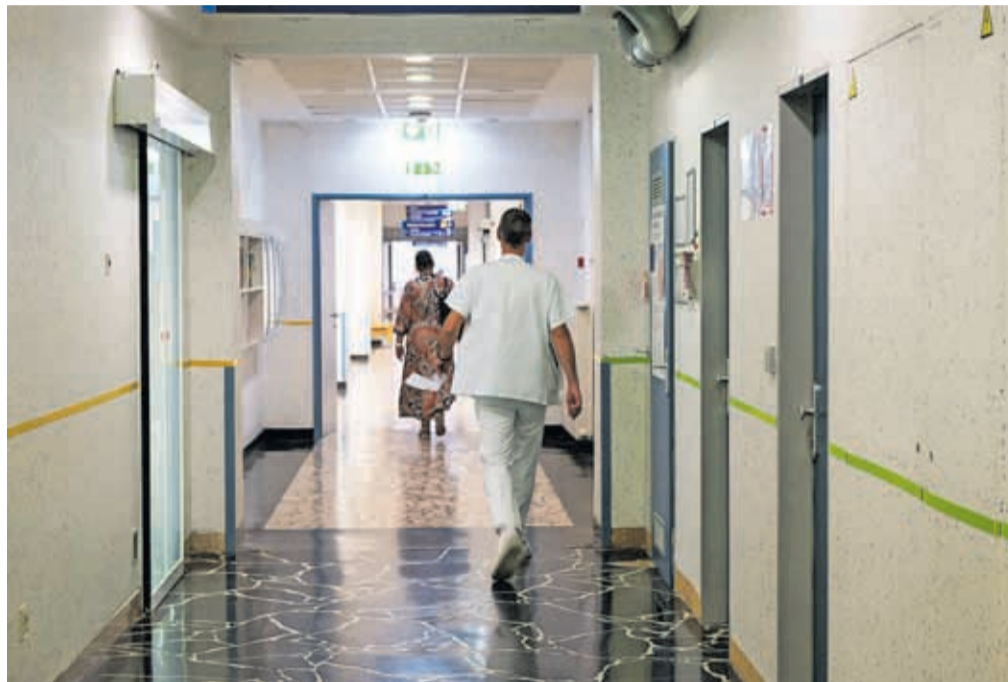
Analiza ministrstva za zdravje naj bi bila izdelana do konca marca. Fotografija je simbolična.