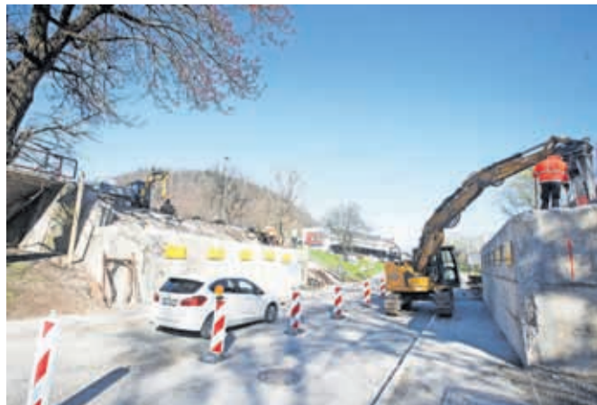
Podvoz v Savski Loki so začeli obnavljati sredi marca.

Kranj – Ta čas poleg obnove mostu čez Savo na Ljubljanski cesti v Kranju poteka tudi obnova bližnjega podvoza v Savski Loki. Dela na obeh objektih bodo končana do konca maja, napovedujejo na Mestni občini Kranj. Za obnovo podvoza se je MOK odločila po tem, ko so se obnovitvena dela na mostu čez Savo zamaknila zaradi posledic lanskih poplav, ko se je poškodovalo gradbeni oder in je bila ogrožena stabilnost kon-