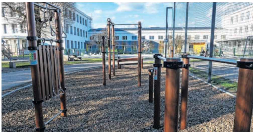
Fitnes na prostem ob Osnovni šoli Janeza Puharja v KS Center

Vodovodni stolp in KS Orehek – Drulovka. »Odzivi kažejo, da se je promet po postavitvi umiril, otroci in drugi smo na vsakodnevni poteh še bolj varni,« so zadovoljni in optimistično razpoloženi v MOK.