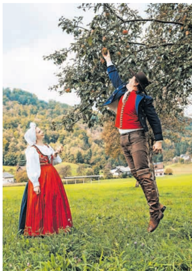
Z AFS Ozara po jabolko rudeče

Vstopnice so že v prodaji in velja si jih čim prej zagotoviti, preden poidejo. Kot potrjujejo ozarčani, jih dobite pri vseh članih skupine oziroma jih naročite na elektronskem naslovu info@drustvo-ozara.si