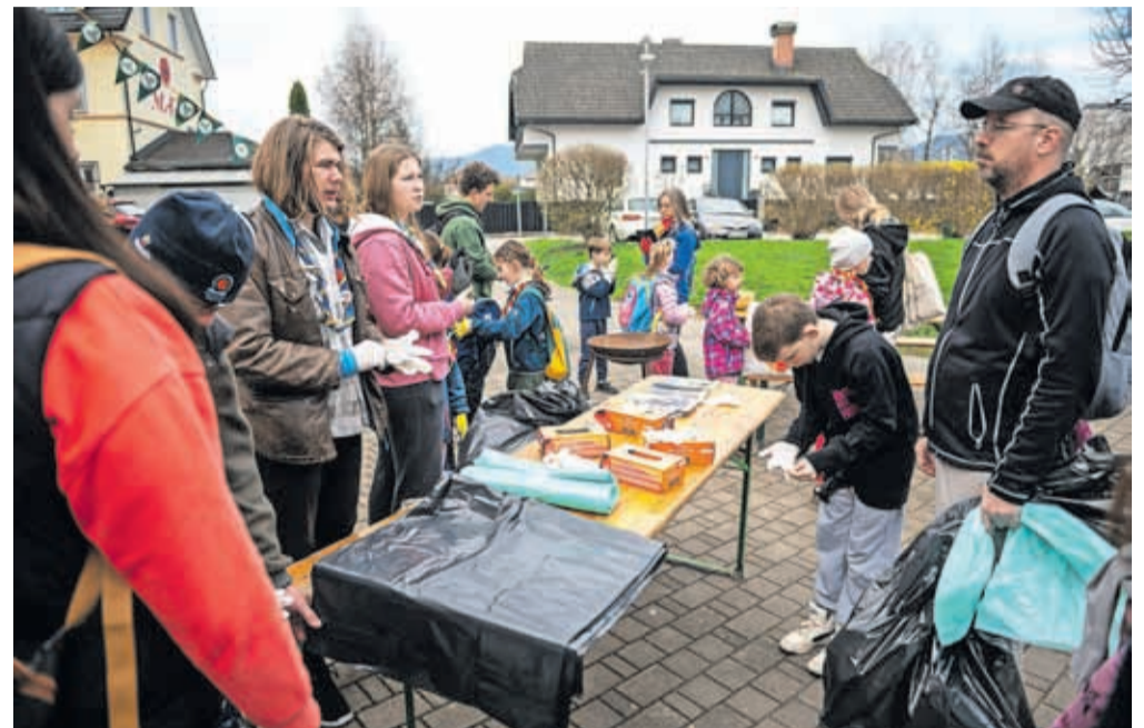
Priprave na čiščenje okolja v Stražišču

V soboto, 23. marca, je potekala splošna čistilna akcija, v kateri so poleg vseh štirih kranjskih taborniških rodov sodelovale še vse enote Civilne zaščite MOK, Komunala Kranj, krajevne skupnosti, prostovoljna gasilska in druga društva, lovske družine