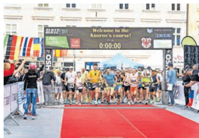
Po lanski uspeli tekmi letos v Kranju pričakujejo še več tekačic in tekačev. / FOTO: DAMJAN KONČAR, ARHIV ORGANIZATORJEV

Kranjska tekma na 12 ur je prejela zlato značko Mednarodnega ultramaratonskega združenja, IAU (International Association of Ultrarunners), kar dokazuje, da gre za tekmo na vrhunskem nivoju, ki je tudi mednarodno poznana. Zlato značko ima le nekaj tekem na svetu.