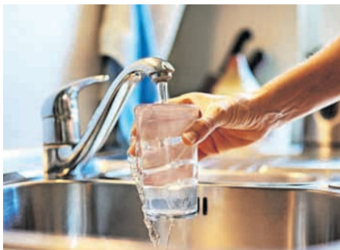
Pitje vode iz pipe je bolj zdravo in do okolja prijaznejše kot pitje vode iz plastenke.

Slovenije. Ena izmed kritičnih infrastruktur v času poplavl je tudi oskrba s pitno vodo. Komunala Kranj tudi v izrednih razmerah uporabnikom v Mestni občini Kranj neprekinjeno in brez omejitev dobavlja pitno vodo. Razlog so predvsem ustrezna infrastruktura in zaposleni v sektorju Vodovod, ki vsakodnevno izvajajo nadzor nad vodovodnimi objekti in sanirajo morebitne okvare vodovodnega omrežja. V primeru poslabšanja kakovosti vodnega vira se le-ta izloči iz oskrbe s pitno vodo. Primanjkljaj vode se nadomešča z aktivacijo rezervnega vodnega vira, v Kranju pomembno zalogo pitne vode predstavlja črpališče Gore-