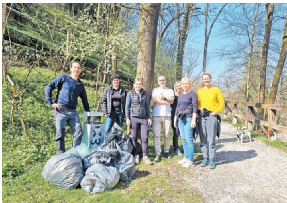
Ekipa ZTKK se je udeležila čistilne akcije Kranj ni več usran. Čistili smo območje kanjona reke Kokre pod mestom.

njanom omogočili ogled ro-rov brez vodnika, saj je to mestna atrakcija, po kateri obiskovalci največkrat sprašujejo. Nadaljujemo pa tudi s tipiziranimi jaški, s katerimi bi obiskovalcem mesta radi predstavili nekaj znanih kranjskih obiskovalcev. Za zdaj imamo jašek z obličjem Janeza Puharja, izumitelja fotografije na steklo. Kot zanimivost naj povem, da letos praznujemo 210. obletnico Puharjevega rojstva. Zato ne bo odveč, če si več o njem preberete na spletni strani VisitKranj, obiščete Kabinet Janeza Puharja, pred njegovo rojstno hišo pa stoji prvi kranjski tipiziran jašek z njegovo podobo. Že v pomladnem času pa bo stekla tudi promocijska akcija, namenjena domačim in tujim gostom. Prav tako se bomo udeležili največje slovenske turistične borze, na kateri bomo tujim turističnim agencijam in tour operaterjem predstavljali svojo ponudbo. Tako računamo, da bo poletje v Kranju zares prešerno. Pomlad je s seboj prinesla lepe dneve, ravno pravšnje za uživanje v zeleni okolici Kranja. Sam rad tečem in kolesarim, tudi kakšen pohod na bližnji hrib mi je v veselje. Pri tem vedno znova