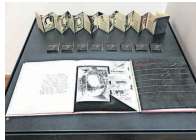
Oblikovalske mojstrovine na temo Prešerna

Morda bi lahko rekli, da je osrednji del razstave na ogled v prvem, tudi prostor-