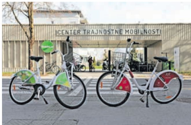
V petek, 29. marca, bomo v sistema KRskOLESOM in eKOLOka vrnili električna kolesa.

prezimovanja koles in tako bomo v petek, 29. marca, v sistema KRskOLESOM in eKOLOka vrnili električna kolesa. Ob dnevu Zemlje, 22. aprila, napovedujemo odprtje sistemov tudi v drugih občinah, ki so povezane v sistem Gorenjska.Bike. Z letnim, mesečnim ali tridnevним paketom Gorenjska.Bike bodo uporabniki