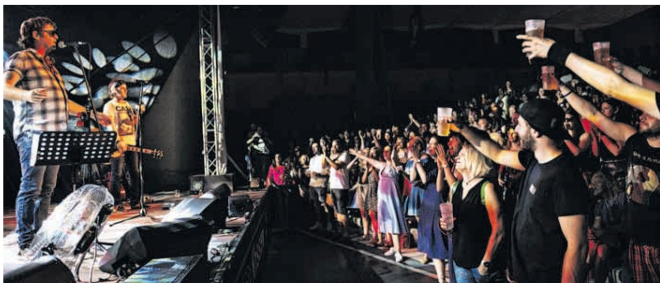
Lani dobrega vzdušja v Letnem gledališču Khislstein ni manjkalo: Big Foot Mama.

ba omeniti še festival sodobnega kolaža Kaos (od 31. maja do 10. avgusta), mednarodni filmski festival Krafft (od 10. do 16. junija), Teden mladih (od 28. junija do 6. julija), Kranfest (od 26. do 27. julija) pa Kranj Foto Fest (od 21. avgusta do 28. septembra) ... Poletje je v Kranju tudi športno obarvano. Tekačem predlagamo 12-urni tek po Kranju (2. junija), odbojkarji so na vrsti julija, ko v Kranju potekata državno prvenstvo v odbojki na mivki in srednjeevropski turnir v odbojki na mivki; 31. avgust in 1. september sta z Veliko nagrado Kranja velika tudi za kolesarstvo. S kolesarjenjem pa se poletje tudi zaključuje. Že tretje leto zapored Kranj gosti L'Etape Slovenia, dogodek za amaterske kolesarje (od 7. do 8. septembra). To je le nekaj utrinkov dogajanja v Kranju v poletni sezoni, a ne bo nič narobe, če si Prešerno poletje v Kranju že vpišete v koledar.