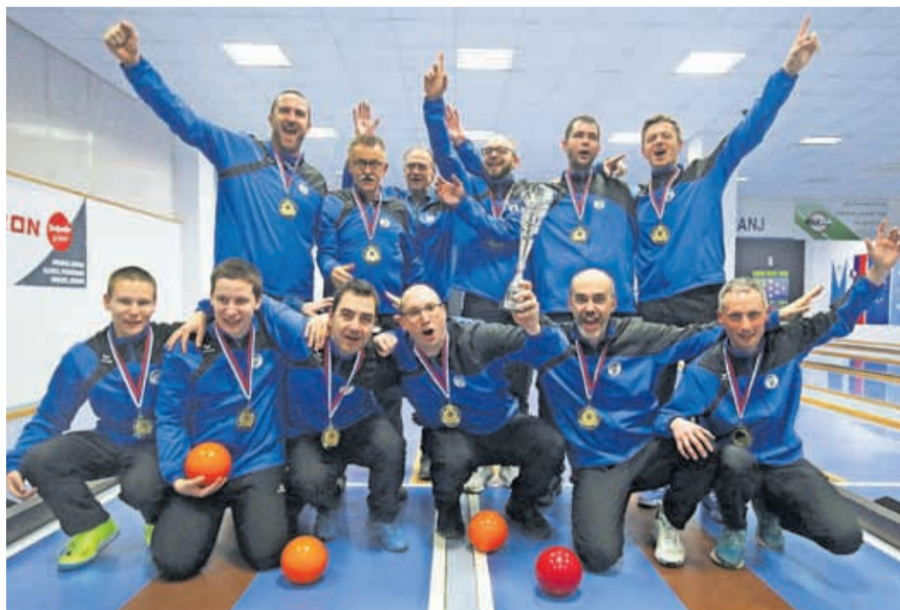
Kegljači Triglava so se veselili naslova državnih prvakov.