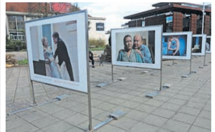
Razstava Fragmenti ljubezni, fragmenti v času je na ogled na Slovenskem trgu.

V času Tedna slovenske drame so na ogled tudi štiri razstave: v Mestni hiši Gorenjskega muzeja je razstava