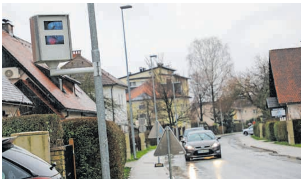
Novi merilnik hitrosti v KS Vodovodni stolp

Kranj – Mestna občina Kranj (MOK) v sodelovanju s krajevnimi skupnostmi (KS) že tretje leto zapored izvaja projekte v skladu z 8. členom Odloka o kriterijih in merilih za financiranje krajevnih skupnosti. V letu 2023 je bilo uspešno izvedenih 69 projektov v skupni vrednosti 564.000 evrov. »Analize kažejo, da smo v primerjavi s prvim letom izvajanja odloka naredili lep korak naprej, spodbudni so tudi kazalci za tekoče leto. Gre za kontinuiran proces, ki ga nadgrajujemo v sodelovanju s sveti naših KS. Tudi v letošnjem letu bomo osredotočeni na redno in investicijsko vzdrževanje infrastrukture. Vedno aktualne so predvsem obnove cest in stavb krajevnih skupnosti, vse več pa je tudi projektov, katerih realizacija ne pomeni dodane vrednosti samo za krajane in občane, pač pa tudi za preostale obiskovalce naše občine. Usklajevanje je ob koncu lanskega in v začetku letošnjega leta potekalo z vsako KS posebej, februarja smo začeli izvajanje. Na voljo bo še več sred-