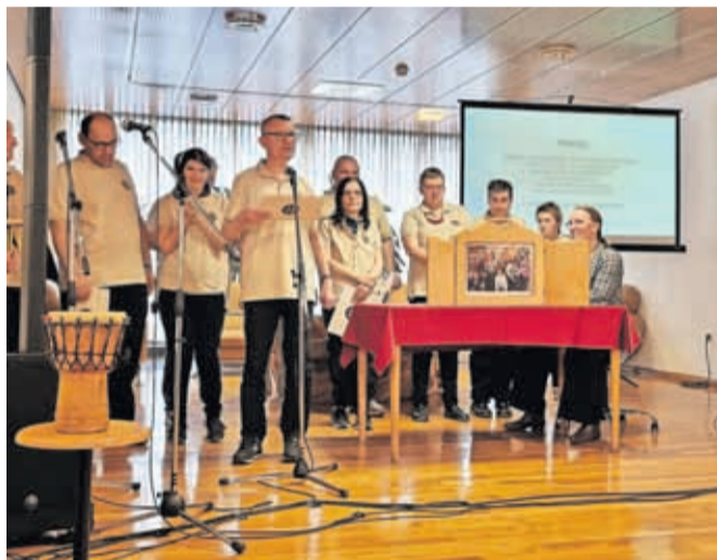
Predstavo o vrednotah so izvedli z uporabo japonske gledališke tehnike kamišibaj.